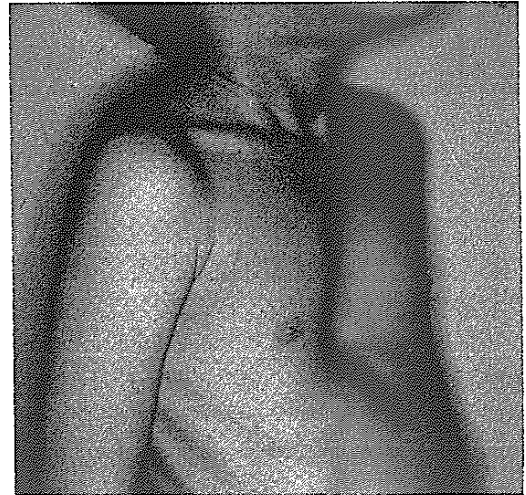
図2 対称性漏斗胸の術前写真(5歳, 男子)

陥凹部位により対称性・右側・左側漏斗胸に分類される。鳩胸は前胸部突出の形態により Pouter pigeon breast と Keeled pigeon breast の 2 型に分類できる。これら鳩胸の胸郭変形も縦隔前方への著しい肺ヘルニアなど、胸腔内臓器の位置異常をきたす。Poland 症候群は、一側性の大胸筋欠損とともに患側に次の異常がみられることが多い。手指の奇形、乳腺または乳暈の発育不全、皮下組